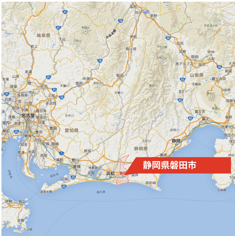
発電所立地:静岡県磐田市