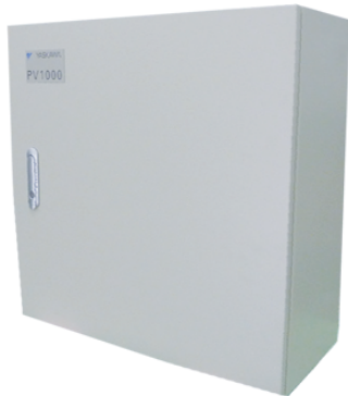
安川電機 10kwパワコン