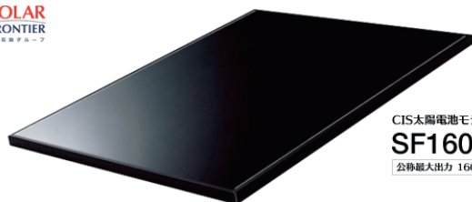
CIS太陽電池モジュール SF160-S 公称最大出力 160W