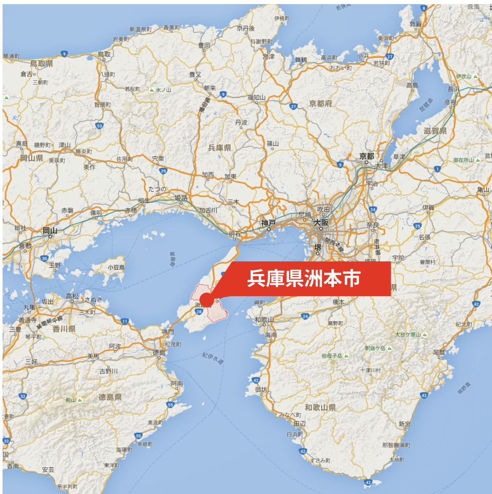
発電所立地:兵庫県洲本市